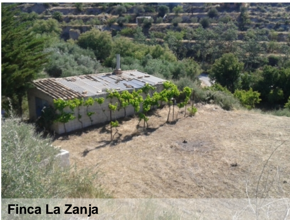
Finca La Zanja