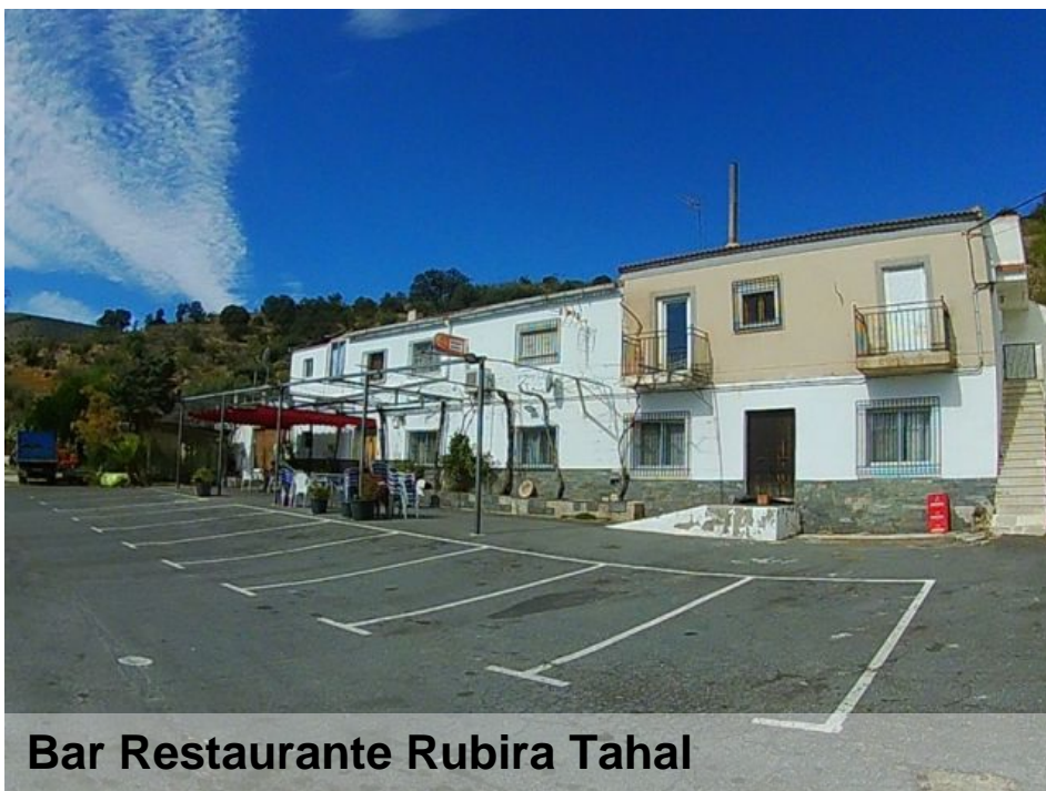
Bar Restaurante Rubira Tahal