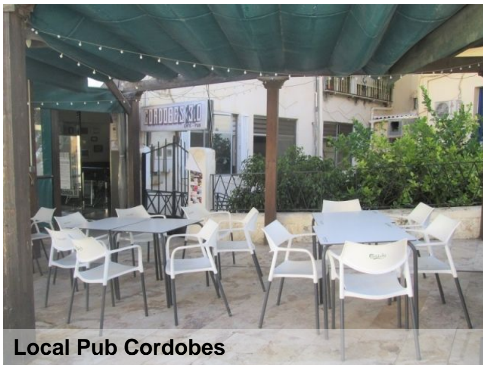
Local Pub Cordobes