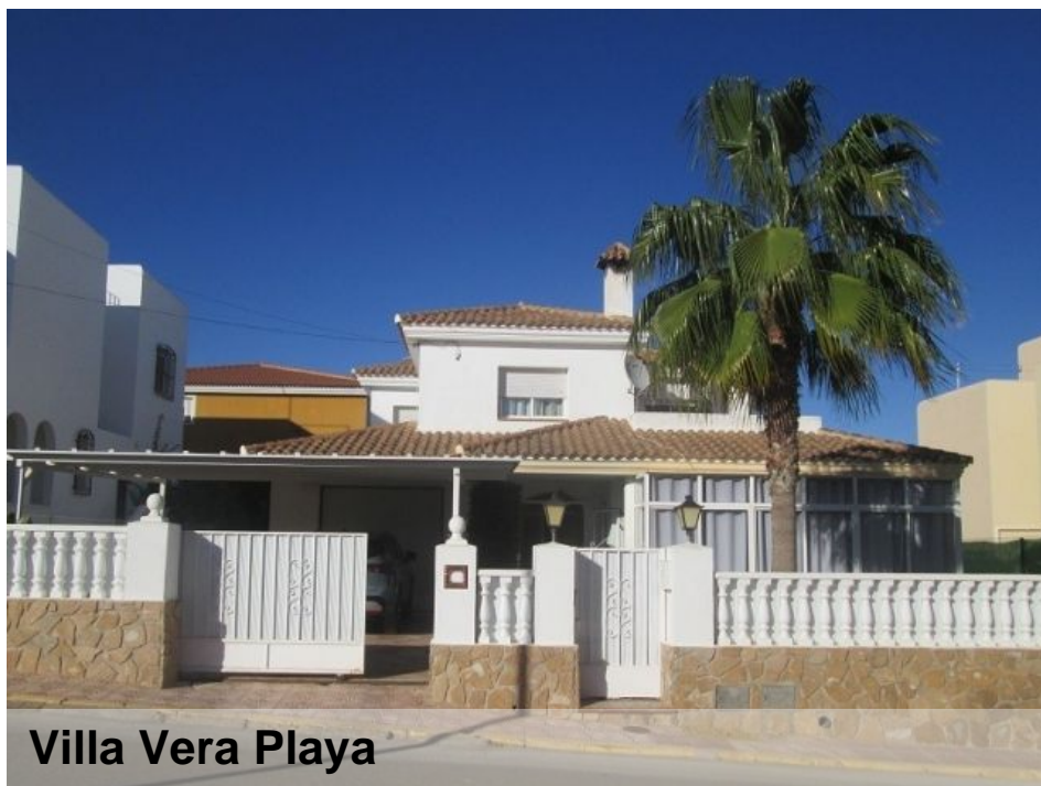
Villa Vera Playa