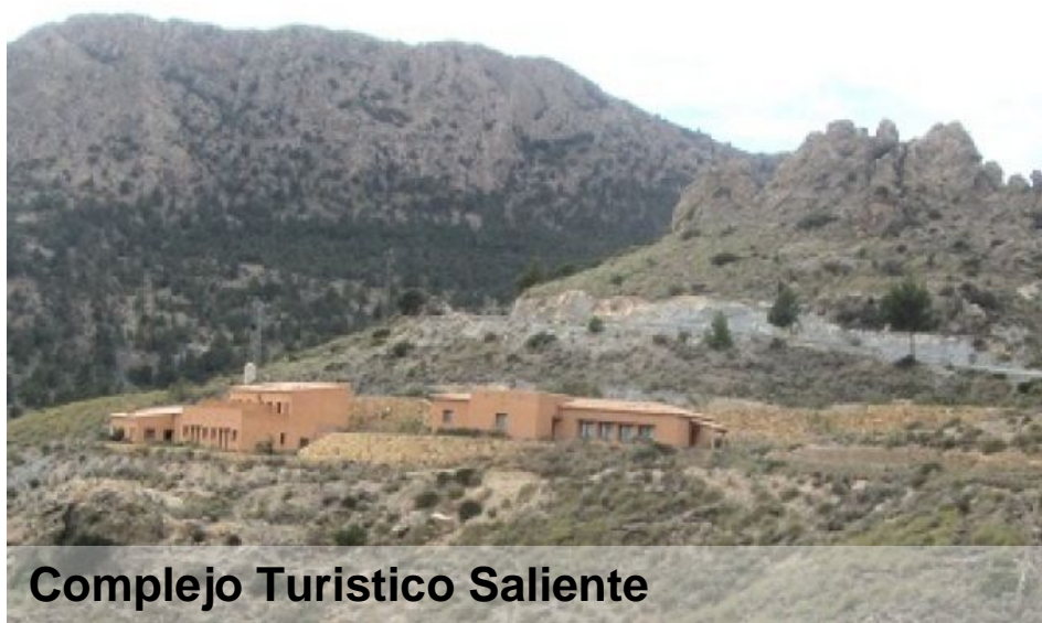
Complejo Turístico Saliente